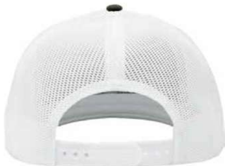
AJUSTADOR DE PLÁSTICO SNAPBACK