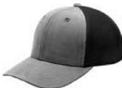
HEATHER GREY BLACK HASTA AGOTAR EXISTENCIA