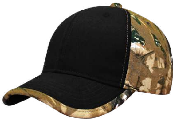
R7671-BLACK CAMO BROWN HASTA AGOTAR EXISTENCIAS