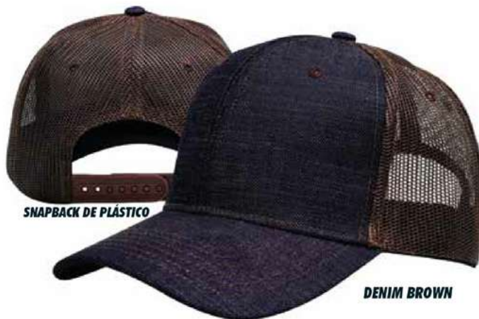
SNAPBACK DE PLÁSTICO