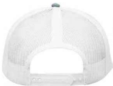
SNAPBACK DE PLÁSTICO.