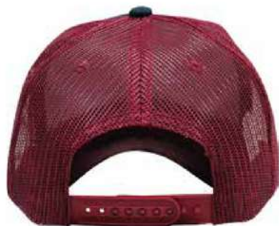
SNAPBACK DE PLÁSTICO