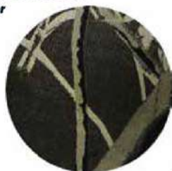
TELA DE ALGODÓN CON POLIÉSTER