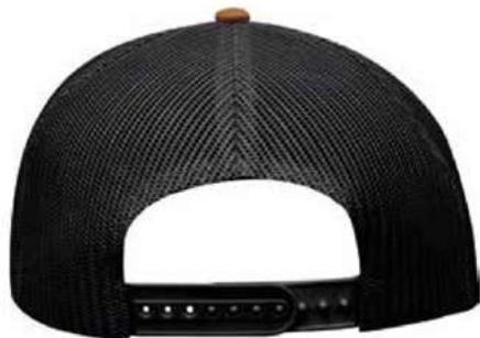
SNAPBACK DE PLASTICO