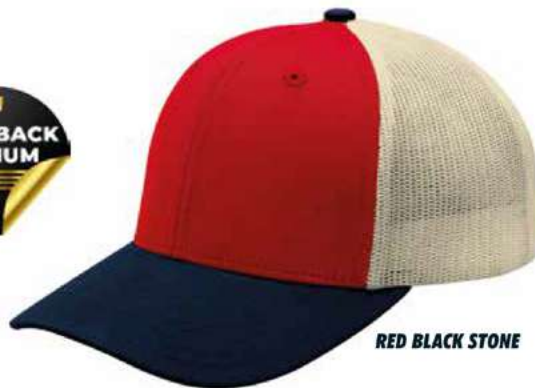
RED BLACK STONE