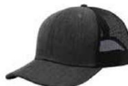
HEATHER BLACK BLACK