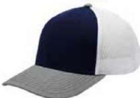
NAVY HEATHER GREY WHITE