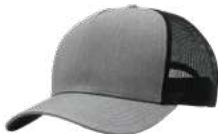
HEATHER GREY BLACK