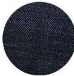
TELA DE MEZCLILLA