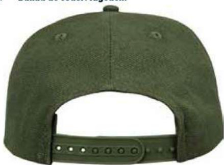
SNAPBACK DE PLÁSTICO