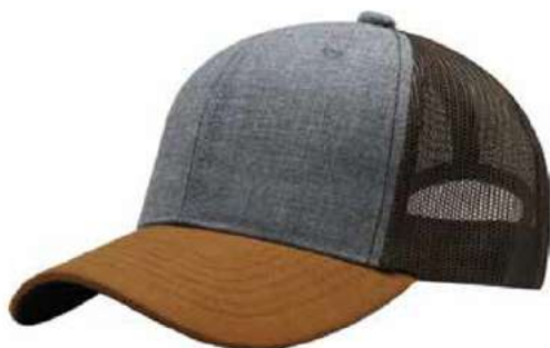
HEATHER GREY CAMEL BROWN