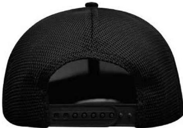
SNAPBACK DE PLÁSTICO