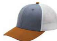
BLUE CAMEL WHITE