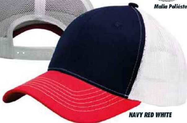
NAVY RED WHITE