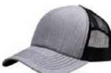
HEATHER GREY BLACK