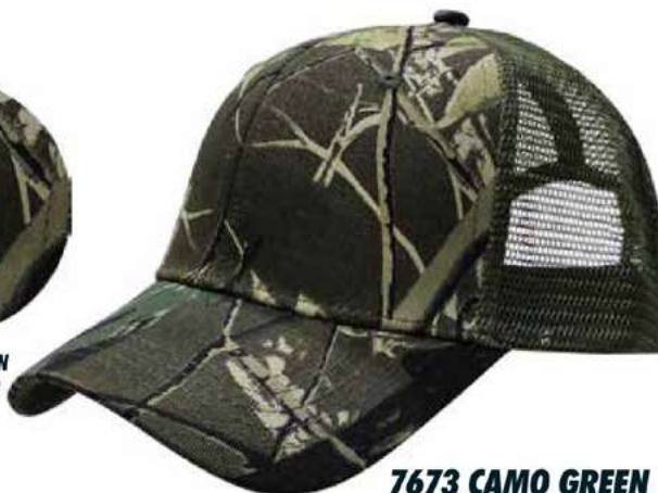
7673 CAMO GREEN