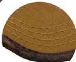
RIBETE EN VISERA EN ALGODÓN ENCERADO