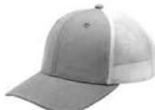
HEATHER GREY WHITE