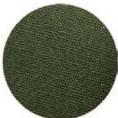
100% ALGODÓN CANVAS