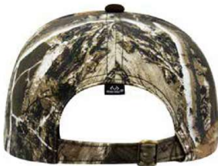
Hebilla metálica ajustable