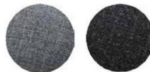
Tipo de tela: Algodón jaspeado