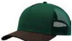
DK GREEN OXFORD GREEN