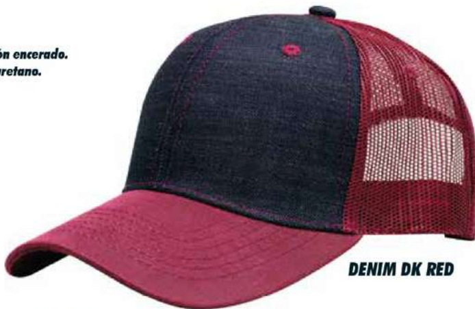
DENIM DK RED