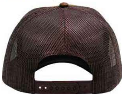
SNAPBACK DE PLÁSTICO.