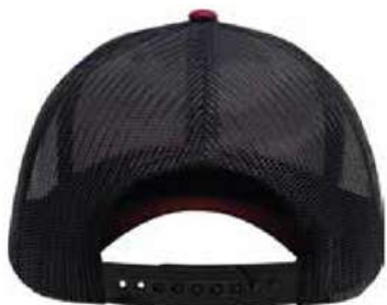
SNAPBACK DE PLÁSTICO