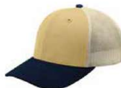
CORN NAVY STONE HASTA AGOTAR EXISTENCIA