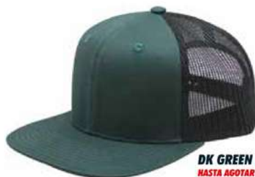
DK GREEN BLACK HASTA AGOTAR EXISTENCIA