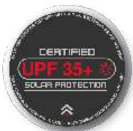
FACTOR DE PROTECCIÓN SOLAR UPF 50+