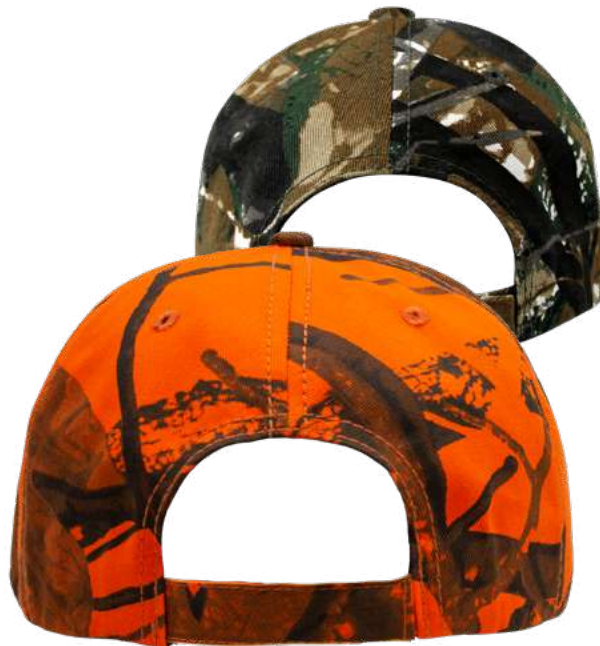
AJUSTADOR DE VELCRO