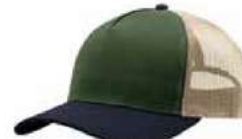
OLIVE NAVY STONE