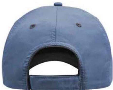
AJUSTADOR DE VELCRO