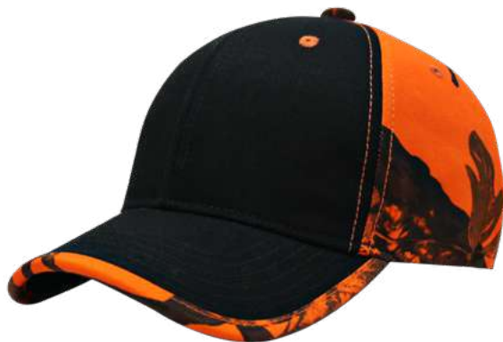
R7671-BLACK CAMO ORANGE