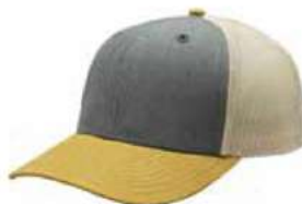
HEATHER GREY MUSTARD STONE HASTA AGOTAR EXISTENCIA