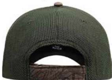
AJUSTADOR DE VELCRO