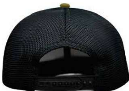
SNAPBACK DE PLÁSTICO