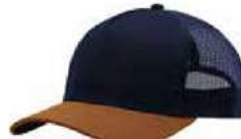
NAVY CAMEL NAVY