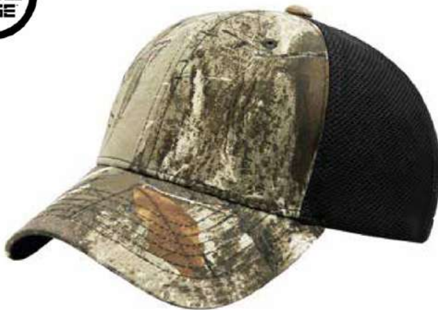
EDGE 02 CAMO MESH BLACK