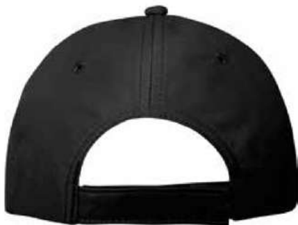
AJUSTADOR DE VELCRO