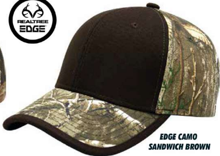
EDGE CAMO SANDWICH BROWN