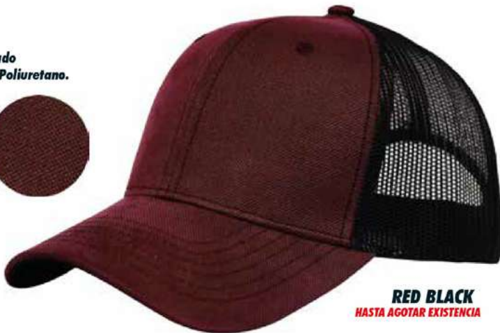
RED BLACK HASTA AGOTAR EXISTENCIA