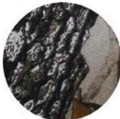
TELA DE POLIÉSTER SUBLIMADO