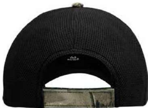
AJUSTADOR DE VELCRO