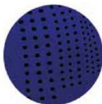
PANELES TRASEROS CON MICROPERFORACIÓN