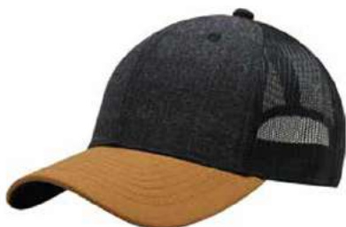
HEATHER BLACK CAMEL BLACK