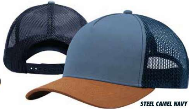
STEEL CAMEL NAVY