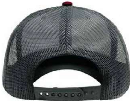
SNAPBACK DE PLÁSTICO