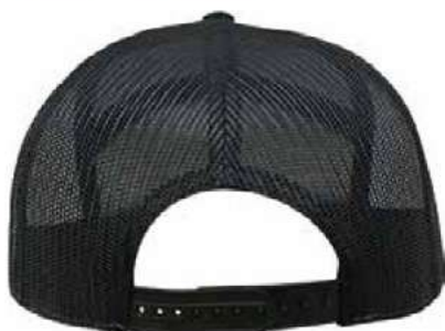
SNAPBACK DE PLÁSTICO