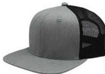
HEATHER GREY BLACK