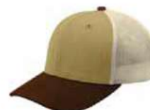
CORN BROWN STONE