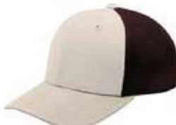
STONE BROWN HASTA AGOTAR EXISTENCIA