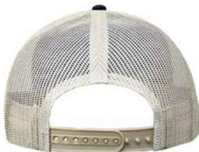
SNAPBACK DE PLASTICO