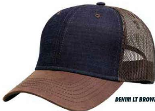
DENIM LT BROWN