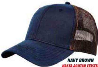
NAVY BROWN HASTA AGOTAR EXISTENCIA