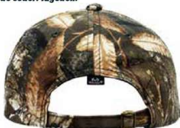
BROCHE HEBILLA METALICA AJUSTABLE