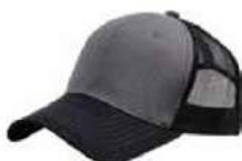
BLACK OXFORD BLACK