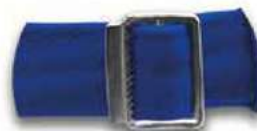
Hebilla metálica ajustable