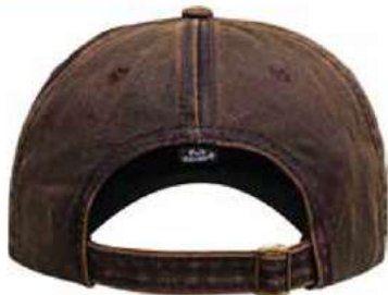
BROCHE HEBILLA METALICA AJUSTABLE