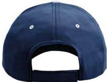
AJUSTADOR DE VELCRO