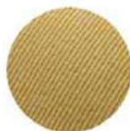
Tipo de tela: Algodón efecto deslave