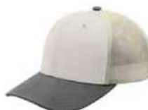
BONE LT GREY STONE