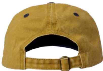
Hebilla metálica ajustable