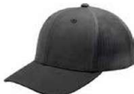
OXFORD HASTA AGOTAR EXISTENCIA