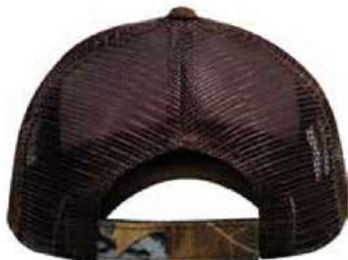
AJUSTADOR DE VELCRO