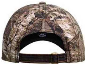
BROCHE HEBILLA METALICA AJUSTABLE