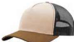
STONE CAMEL OXFORD