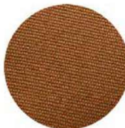
TELA DE ALGODÓN CANVAS