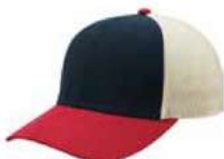
NAVY WINE STONE