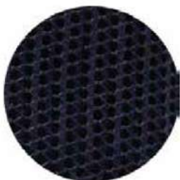
MALLA DE POLIÉSTER