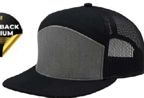
BLACK HEATHER GREY BLACK