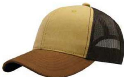
MUSTAGE CAMEL BROWN