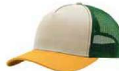
BONE MUSTARD GREEN