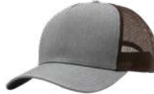
HEATHER GREY BROWN HASTA AGOTAR EXISTENCIAS