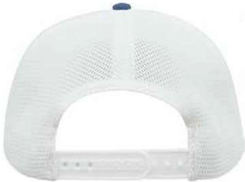
SNAPBACK DE PLÁSTICO.