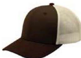
BROWN STONE HASTA AGOTAR EXISTENCIA