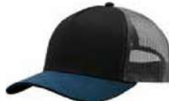
BLACK STEEL OXFORD