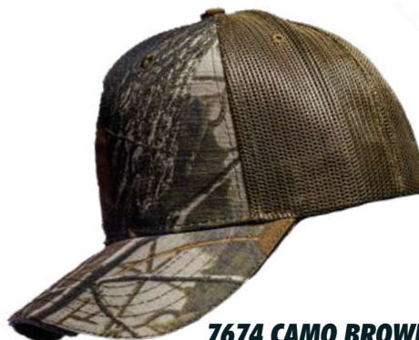
7674 CAMO BROWN