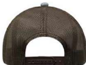
SNAPBACK DE PLÁSTICO.