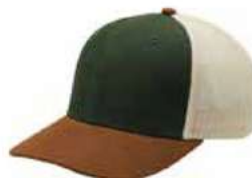
OLIVE BROWN STONE