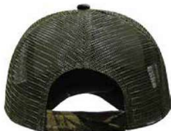
AJUSTADOR DE VELCRO