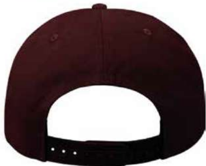
SNAPBACK DE PLASTICO