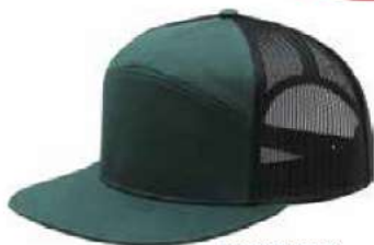
DK GREEN BLACK