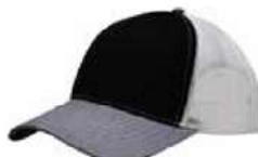
BLACK HEATHER GREY WHITE