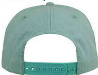
SNAPBACK DE PLÁSTICO