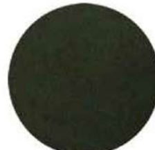
TELA TÁCTO ALGODÓN