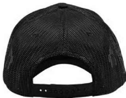
SNAPBACK DE PLÁSTICO.