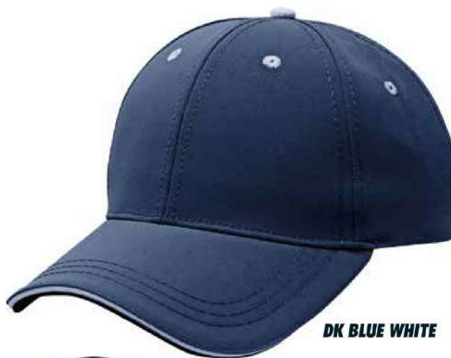
DK BLUE WHITE