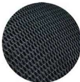
MALLA SUAVE DOBLE CAPA POLIÉSTER