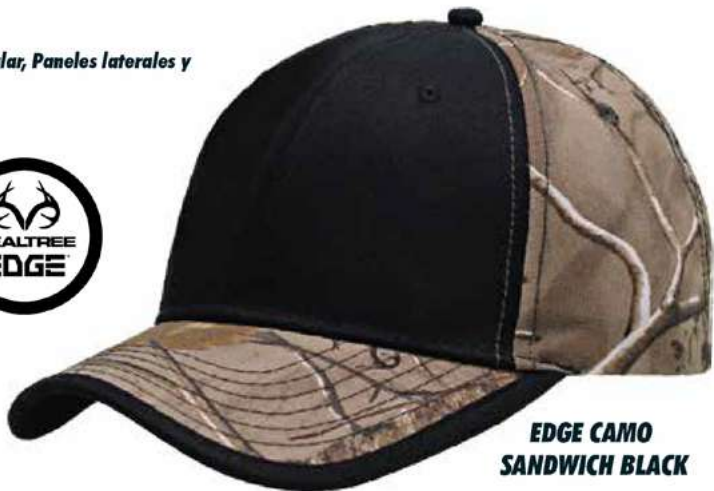
EDGE CAMO SANDWICH BLACK