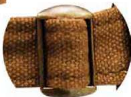
HEBILLA METÁLICA AJUSTABLE