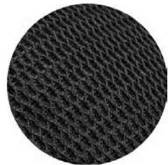
MALLA DOBLE CAPA POLIÉSTER